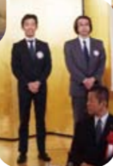
新会員の紹介をしました