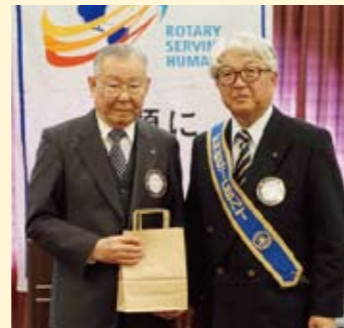
誕生祝い 古川会員