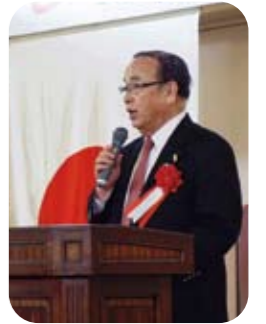
佐野英之ガバナー挨拶