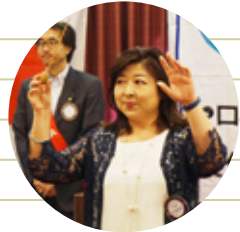
戸張ソングリーダー