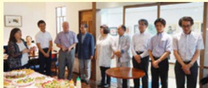
本年度親睦活動委員会メンバー紹介