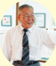
古川会長エレクトによる 中締め