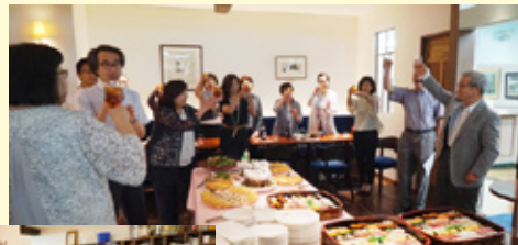
道岸 PP のご発声で カンパイ