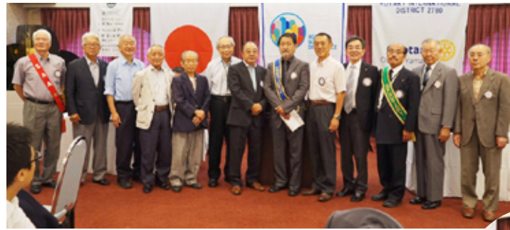
2017~18年度理事役員の方々