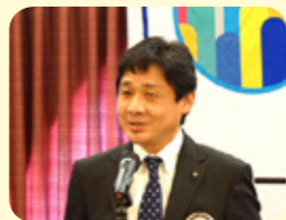
発表 馬郡 社会奉仕委員