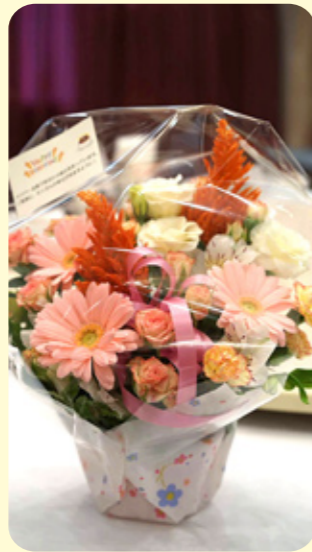
ご夫人お誕生祝いのお花