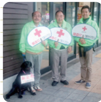
【献血】 日時/場所 10月29日(日) イオンモール大和 献血受付数 50名