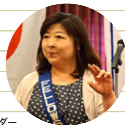
戸張ソングリーダー