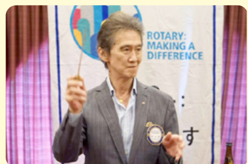
初山ソングリーダー