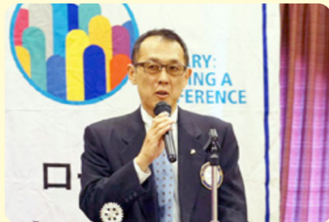
クラブフォーラム富岡青少年奉仕委員長