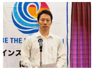
出席報告 松川出席委員