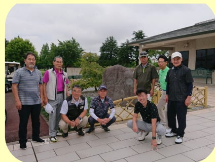
ゴルフ場ハウス前