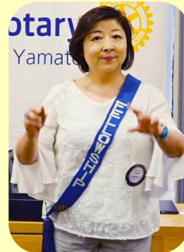
親睦委員会 / 戸張会員