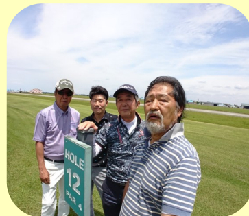
12番ホール飛行場を背にして