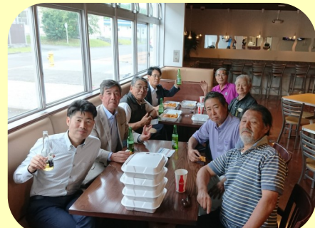
場内レストランにて