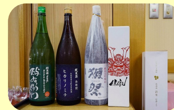
お土産のお酒で、大盛り上がり