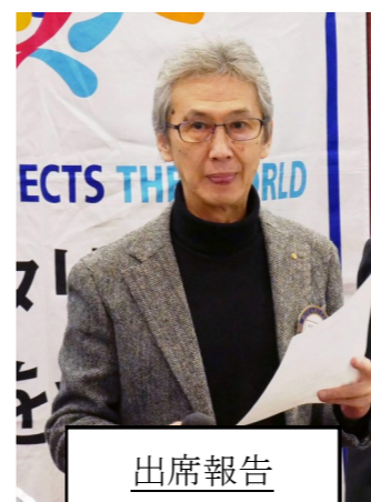
出席報告 榎山会員