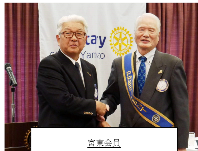
宮東会員 Happy Birthday!