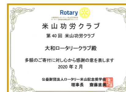
米山功労クラブとして 表彰されました。