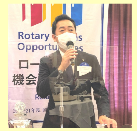
常警次年度ガバナー補佐