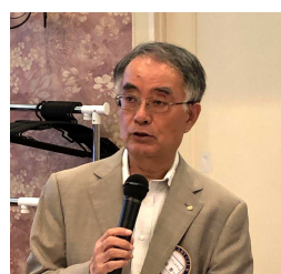
吉岡会長エレクト 次年度のお弁当について