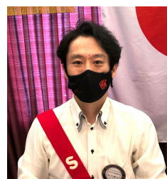
松川 青少年奉仕委員長 絵画コンクール協賛金について