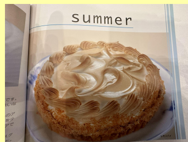
☆四季を表現した鮮やかな彩りの美味しいスイーツ☆ ※クドウのフォーシーズンズスイーツより抜粋