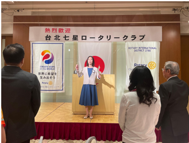
★ソングリーダー植松会員★