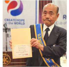
米山功労クラブとして 表彰されました