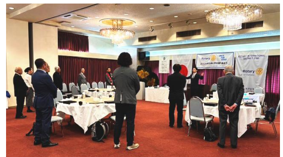
↑ ロータリーソング斉唱