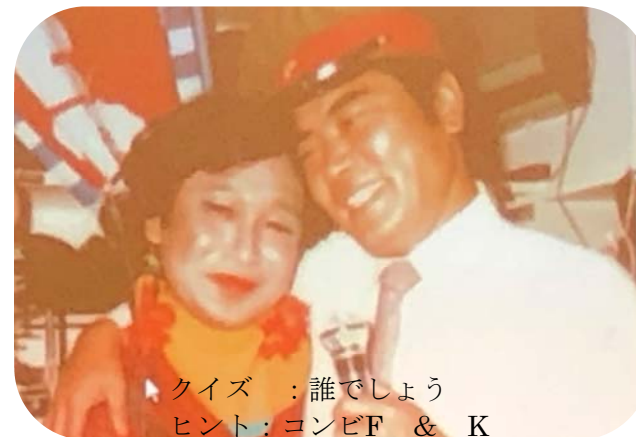
クイズ：誰でしょう ヒント：コンビF & K