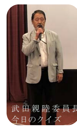
武田親睦委員長 今日のクイズ